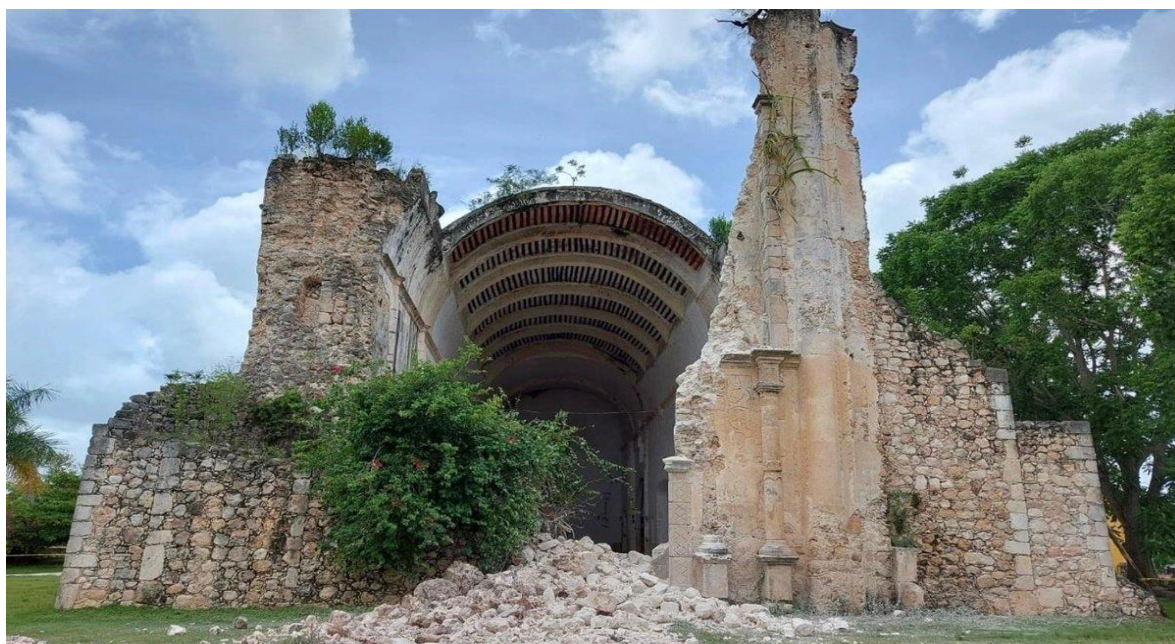
Portada de Tihosuco destruida por las lluvias de junio de 2021. El Universal .

https://www.eluniversal.com.mx/cultura/lluvias-derrumban-parte-de-la-fachada-del-templo-de-tihosuco