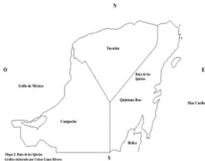
Mapa 2: Ruta de las Iglesias Gráfico elaborado por Celcar López Rivero.