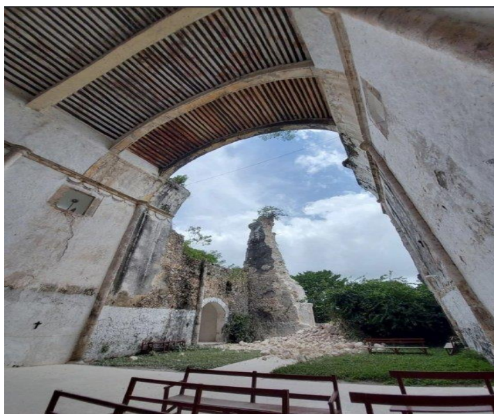
Los restos del coro y parte de madera incrustada en la parte superior del interior del pórtico se perdió por el derrumbe. El Universal . https://www.eluniversal.com.mx/cultura/lluvias-derrumban-parte-de-la-fachada-del-templo-de-tihosuco

https://www.eluniversal.com.mx/cultura/lluvias-derrumban-parte-de-la-fachada-del-templo-de-tihosuco