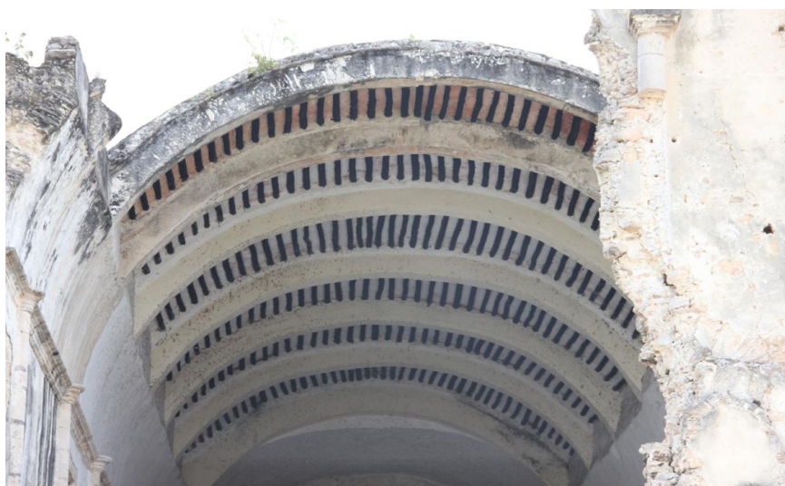
Acercamiento segundo cuerpo de la portada parte de una columna cilíndrica con capitel dorico destruido por las lluvias de junio de 2021. Fotografía de Luis Ángel Rosado tomada en mayo de 2015.