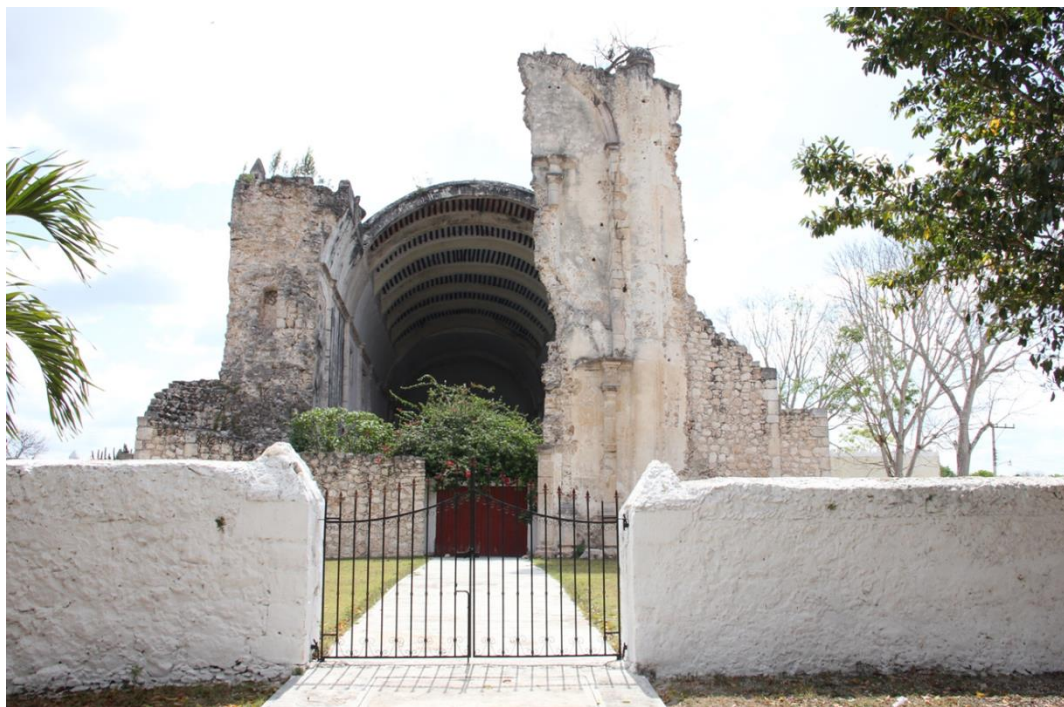
Portada de la Iglesia de Tihosuco destruida por la Guerra de Castas. Fotografía de Luis Ángel Rosado tomada en mayo de 2015.